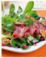
Herbstgenuss Feldsalat mit geräucherter Entenbrust