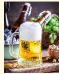
Hopfenliebe Bierspezialitäten für den Herbst