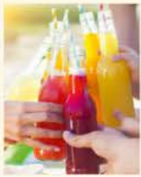
Erntezeit Frische Säfte für Genießer